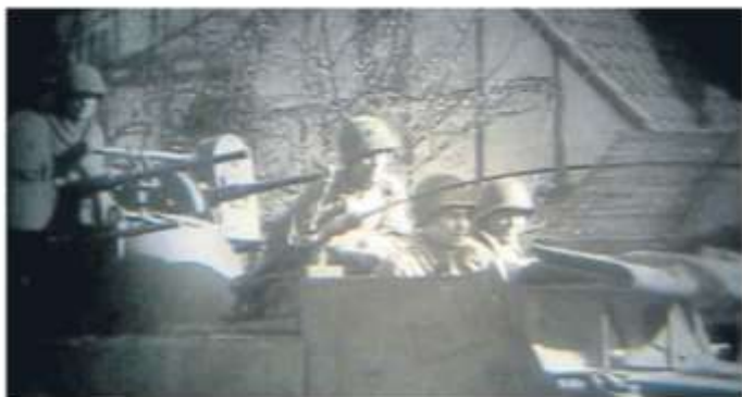
Kriegsende vor 75 Jahren: Zwischen dem 5. und 8. April 1945 marschierten amerikanische Truppen im Kreis Hofgeismar ein. Dieses Foto aus einem Film der US-Armee entstand in Eberschütz, eine kleine Ortschaft, welche damals besetzt wurde.